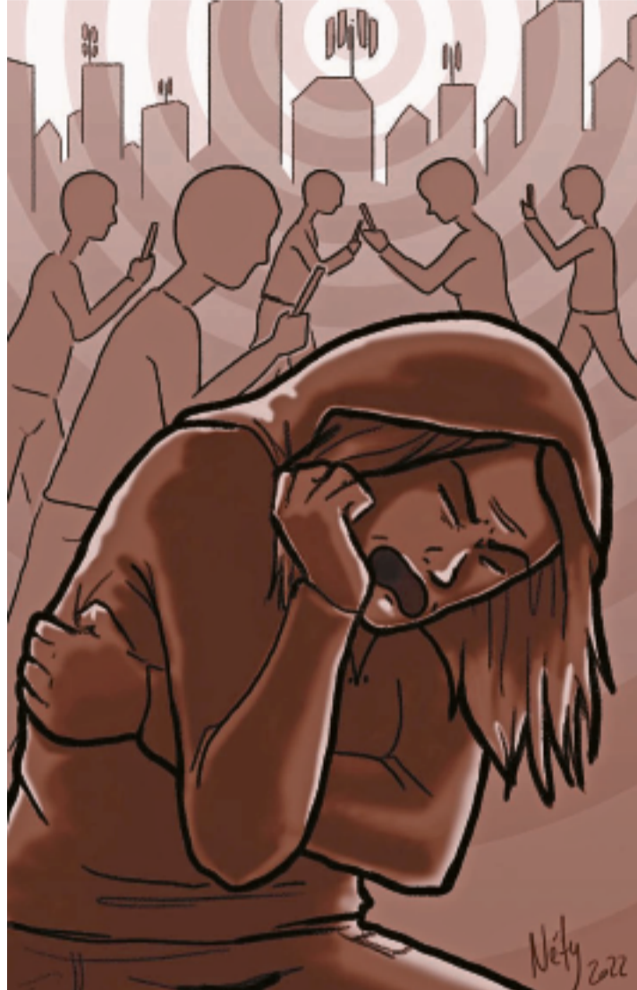
Nadège, jeune Jurassienne intolérante aux ondes, a tenu à témoigner par l'illustration, des douleurs provoquées par les champs électromagnétiques.

Les symptômes de l'électrohypersensibilité ou syndrome d'intolérance aux champs électromagnétiques peuvent prendre la forme de vertiges, de troubles oculaires, d'une certaine confusion, de lésions cutanées ou de maux de tête. «C'est un état quasi permanent qui empêche de dormir